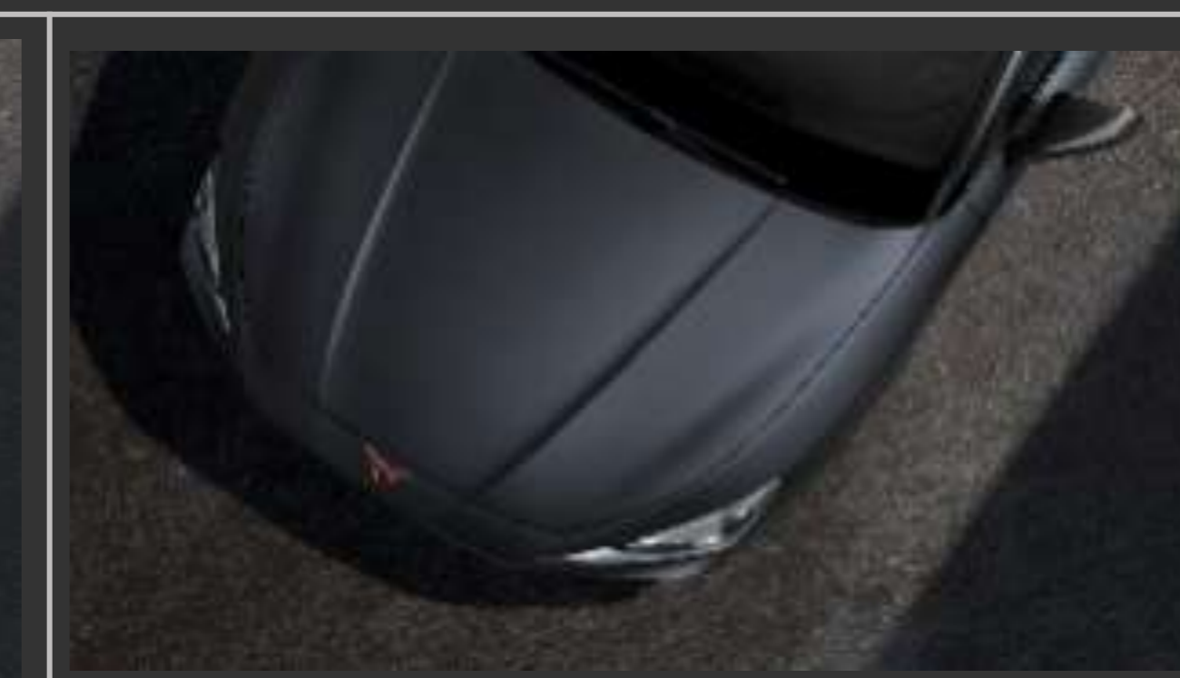
Magnetic tech Matt