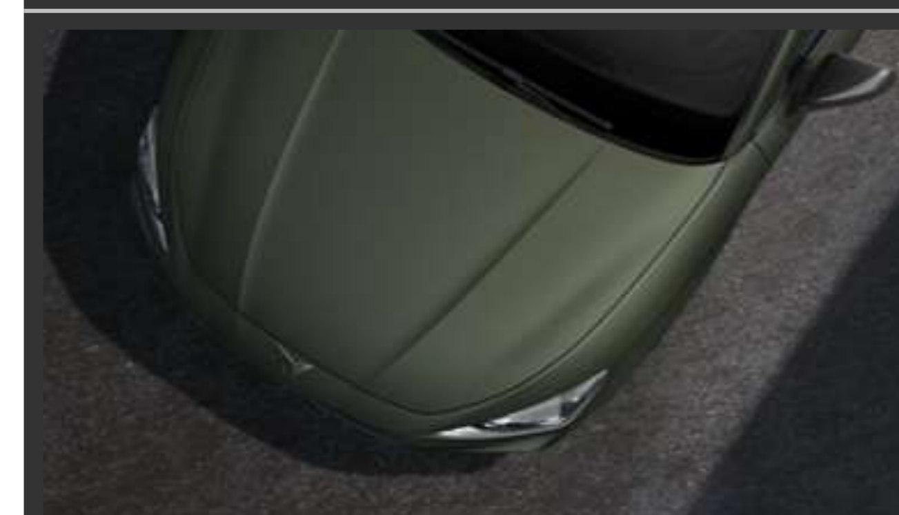
Manganese Matt Nowy lakier, dedykowany dla Tribe Edition / VZ Tribe Edition