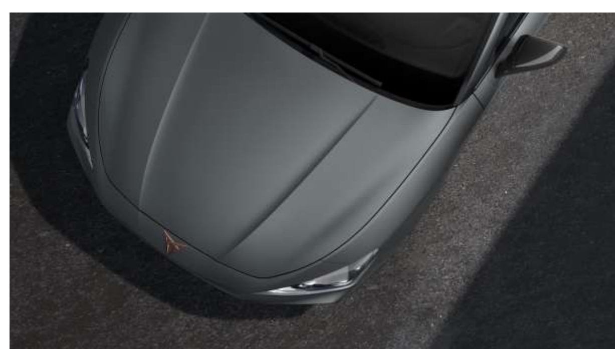
Enceladus Grey Matt