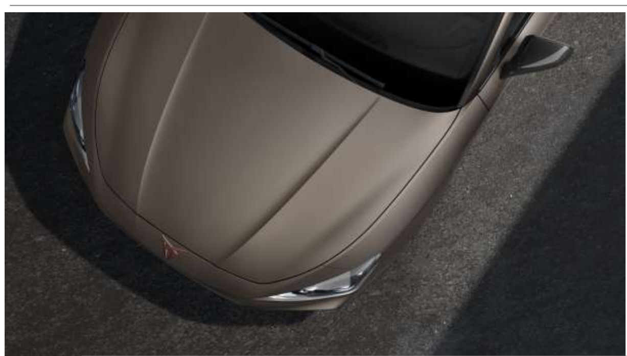
Century Bronze Matt