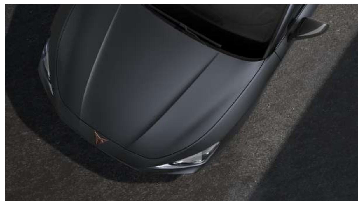
Magnetic Tech Matt