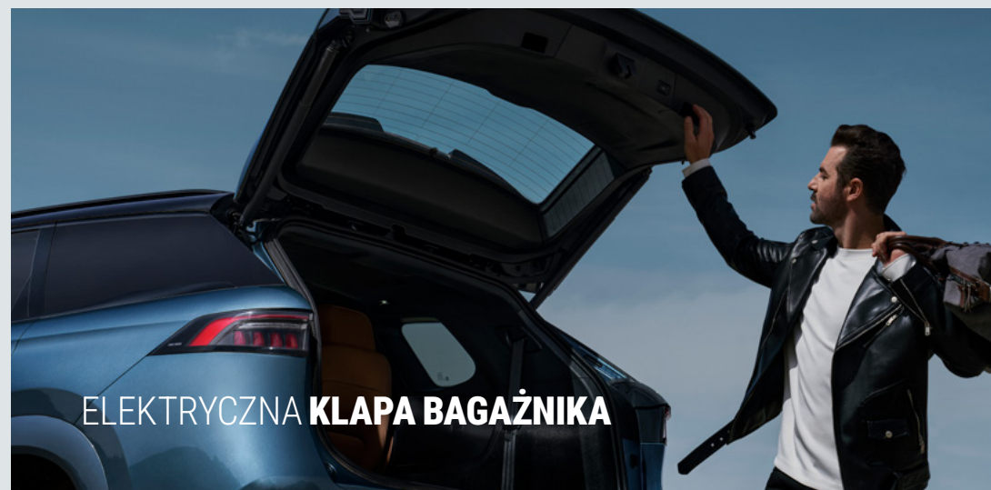
ELEKTRYCZNA KLAPA BAGAŻNIKA