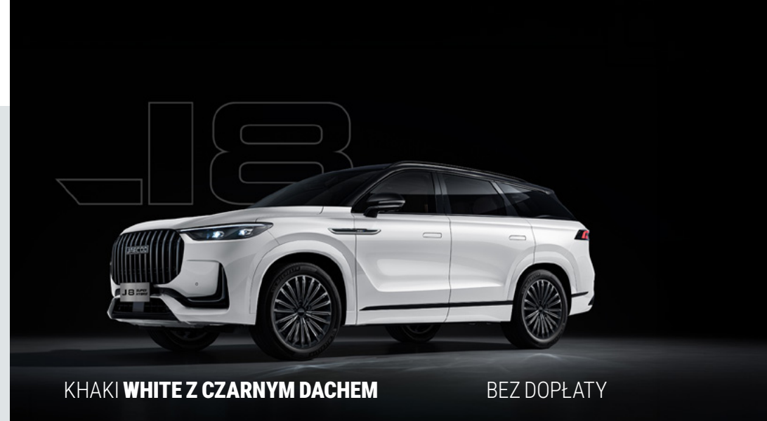
KHAKI WHITE Z CZARNYM DACHEM