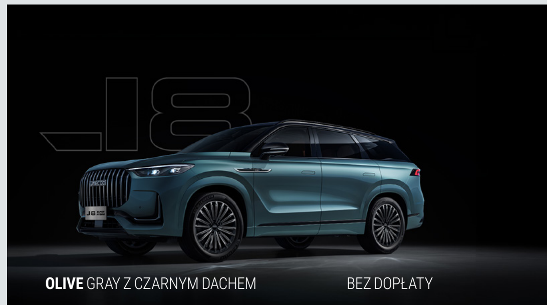
OLIVE GRAY Z CZARNYM DACHEM