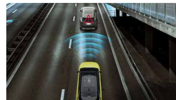
System ostrzegający przed kolizją czołową LCW oraz system automatycznego hamowania awaryjnego AEB