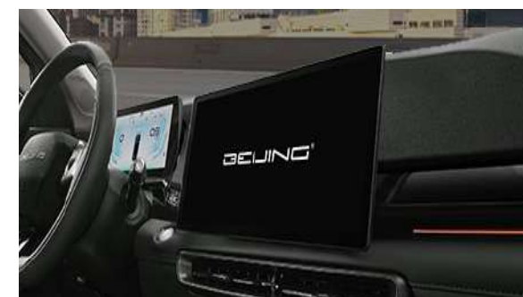
Dotykowy ekran multimedialny o przekątnej 10,1-cala