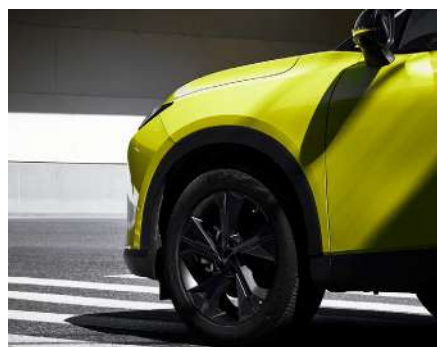
19-calowe felgi aluminiowe