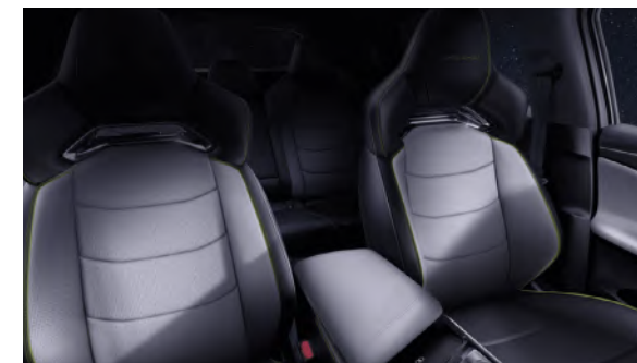
Ogrzewane i wentylowane przednie siedzenia