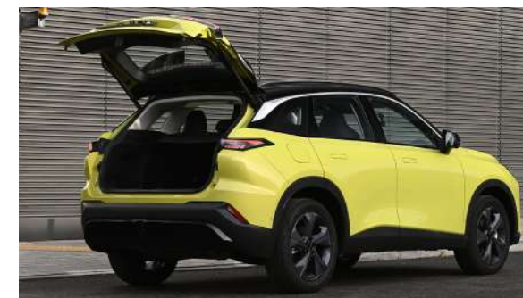
Elektrycznie otwierana kłapa bagażnika