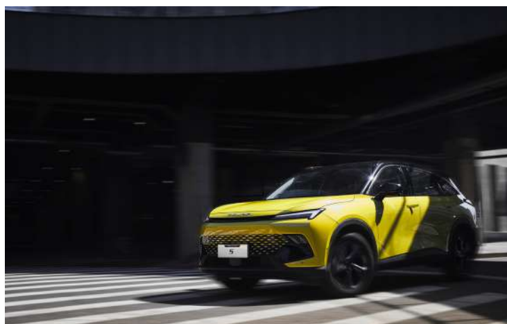
Tryby jazdy (ECO / Sport / Comfort / Smart)