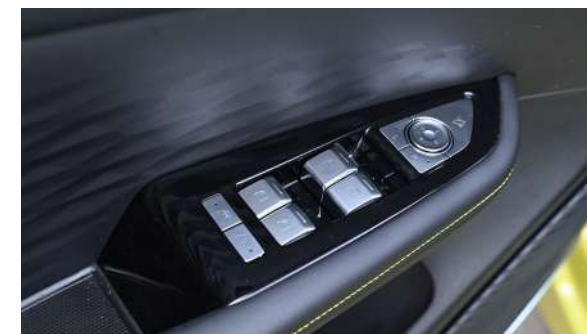
Szyby sterowane elektrycznie (Auto Up / Down)