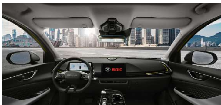
Wielokolorowe podświetlenie wnętrza