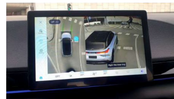
System kamer 360°