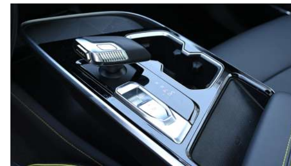
Elektroniczne sterowanie automatyczną skrzynią biegów 7DCT