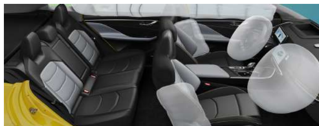
Poduszki powietrzne kierowcy i pasażera oraz kurtyny boczne