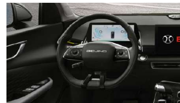
Kierownica wielofunkcyjna z 4-kierunkową regulacją