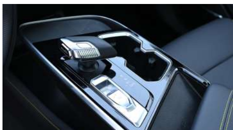
Elektryczny hamulec postojowy EPB