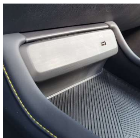
Ładowarka indukcyjna oraz porty USB