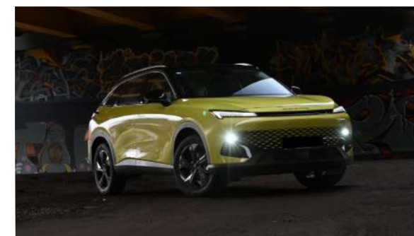
Automatyczne włączanie i wyłączenie świateł