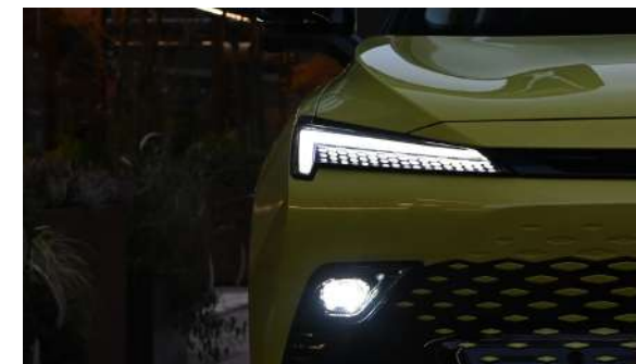
Zaawansowane reflektory przednie LED