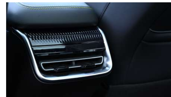
Nawiewy powietrza dla dla pasażerów drugiego rzędu